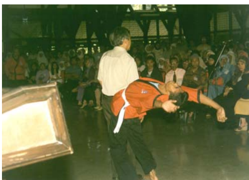
Gambar 8 Imbas ' tenaga dalam '

larikan diri; akan tetapi saat tabrakan, kebetulan mobil Pelatih tersebut tepat berada di lokasi, maka yang melihat beranggapan mobil Pelatih tersebutlah yang menyebabkan kecelakaan. Dengan beringas kelompok orang tersebut menghentikan mobilnya. Melalui kaca jendela mereka berusaha merebut kunci mobil, tetapi tangan-tangan mereka terhenti seperti tertahan, tidak bisa merebut dari tangan Pelatih yang memegang kunci tersebut. Disisi jendela mobil lainnya, terlihat seseorang melayangkan ' bogem mentah ' kepadanya, akan tetapi bagaimanapun usaha tersebut dilakukan, tidak satu pun mencapai sasaran. Tangannya terhenti tanpa menyentuh bagian yang dipukul, dan Pelatih yang terlibat juga tidak merasa adanya hantaman tinju pada tubuhnya. Setelah korban menjelaskan situasi, bahwa dia diserempet angkot yang kabur, kemudian motornya menghantam sisi mobil Pelatih, kelompok yang beringas tersebut kemudian diam dan hanya jongkok di pinggir jalan melihat korban, polisi dan Pelatih berbicara.